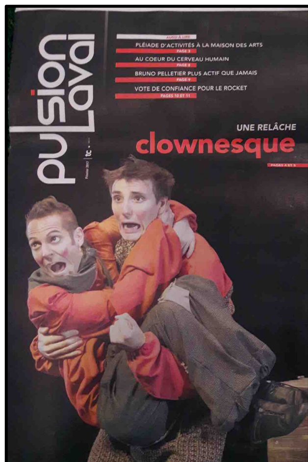
Page couverture Pulsion Laval «Une relâche clownesque» Crédit : Pulsion Laval, 1 er février 2017